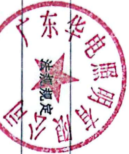
生产建设项目水土保持方案审批随机抽查公示信息表