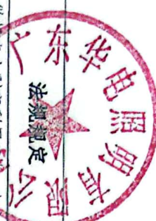
生产建设项目水土保持方案审批随机抽查公示信息表