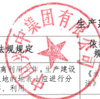
生产建设项目水土保持方案审批随机抽查公示信息表