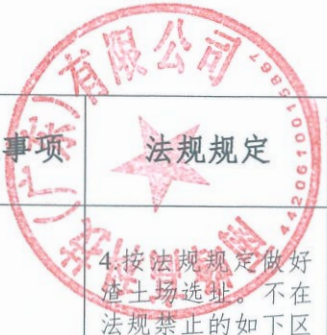
生产建设项目水土保持方案审批随机抽查公示信息表