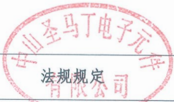
生产建设项目水土保持方案审批随机抽查公示信息表