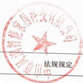
生产建设项目水土保持方案审批随机抽查公示信息表